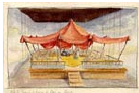
Scénographie de Peer Gynt , de H. Ibsen