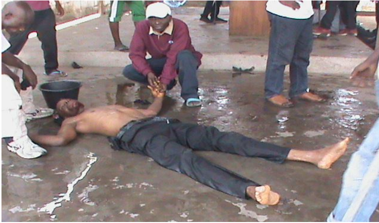
L'attaque des policiers de kabila jusqu'à la permanence du Parti (3 photos ci-dessous) (Attack of the Kabila's police to headquarters of the party (3 pictures below))