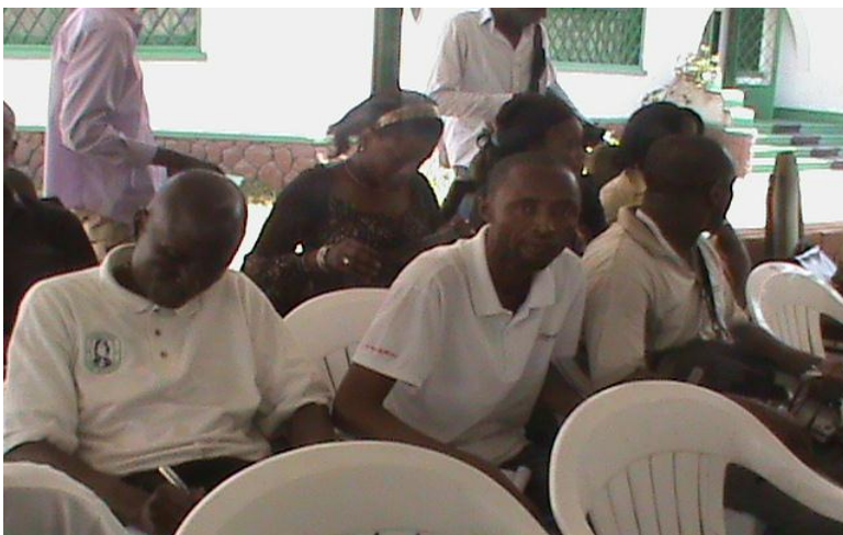
Une vue partielle de l'assistance. (A partial view of the audience.)