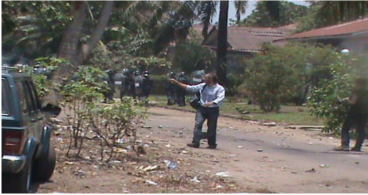
Le journaliste de l'AFP constate l'ampleur du désastre. (The journalist of AFP notes the scale of the disaster.)