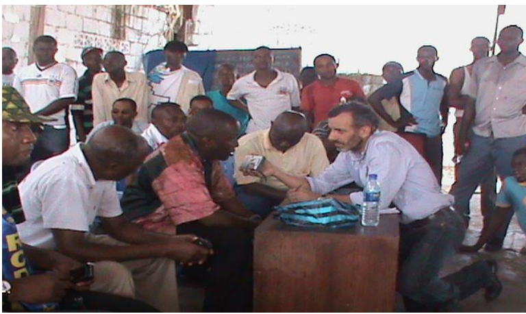
Le S.G. interviewé par l'A.F.P. au Siège du Parti après la répression de la marche. (The Secretary-General interviewed by AFP Headquarters of the Party after the suppression of the march.)