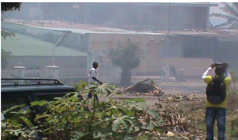
Le désastre après l'attaque (The disaster after the attack)