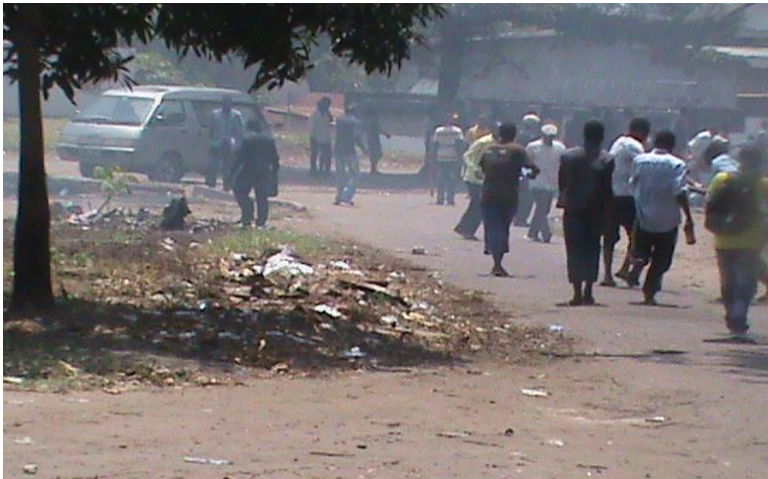
Le repli des combattants à la permanence du Parti. (Withdrawal of combatants to the permanence of the Party) LE POINT DE PRESSE DE L'UDPS ET SES ALLIES APRES LA REPRESSION DE LEUR MARCHE PACIFIQUE. (the briefing of the UDPS and its allies after the repression of their peaceful march.)